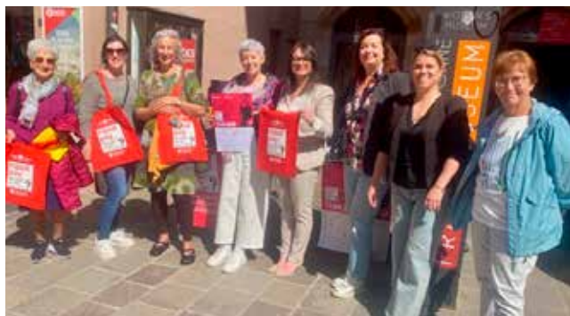
Gut besetzter und gut besuchter Infostand in Meran