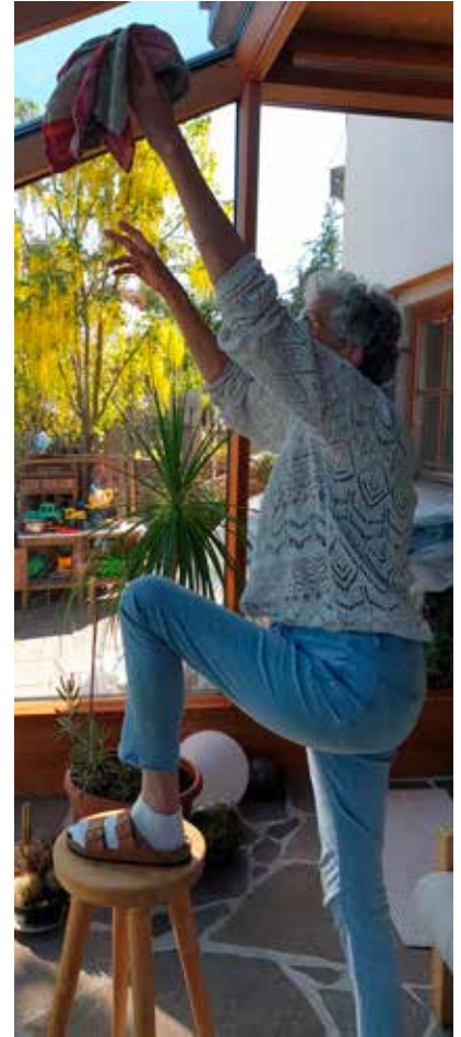
Zu vermeiden: Auf einen Hocker steigen!