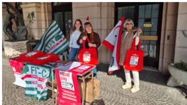
Lo stand della Federazione trasporti FIT e della Federazione Pensionati FNP in stazione a Bolzano.