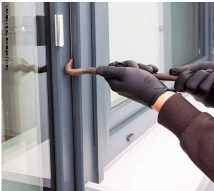
Prevenire furti con scasso: finestre, portefinestre e le porte dei balconi possono essere rese più sicure.

Un altro aspetto da considerare è l'installazione di sistemi di allarme e di videosorveglianza; anche questo settore è molto vasto e comprende una vasta gamma di soluzioni. Gli esperti (tra cui anche le forze dell'ordine) sono ben disposti a offrire la loro consulenza.